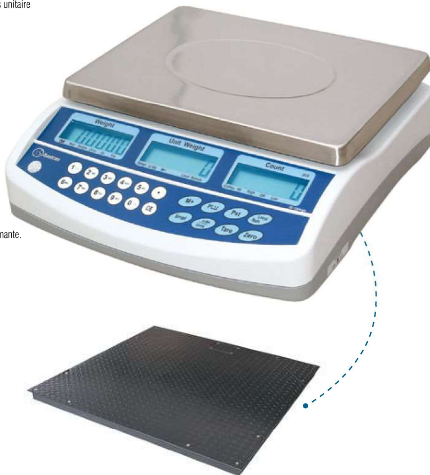
Connectable à plate-forme auxiliaire